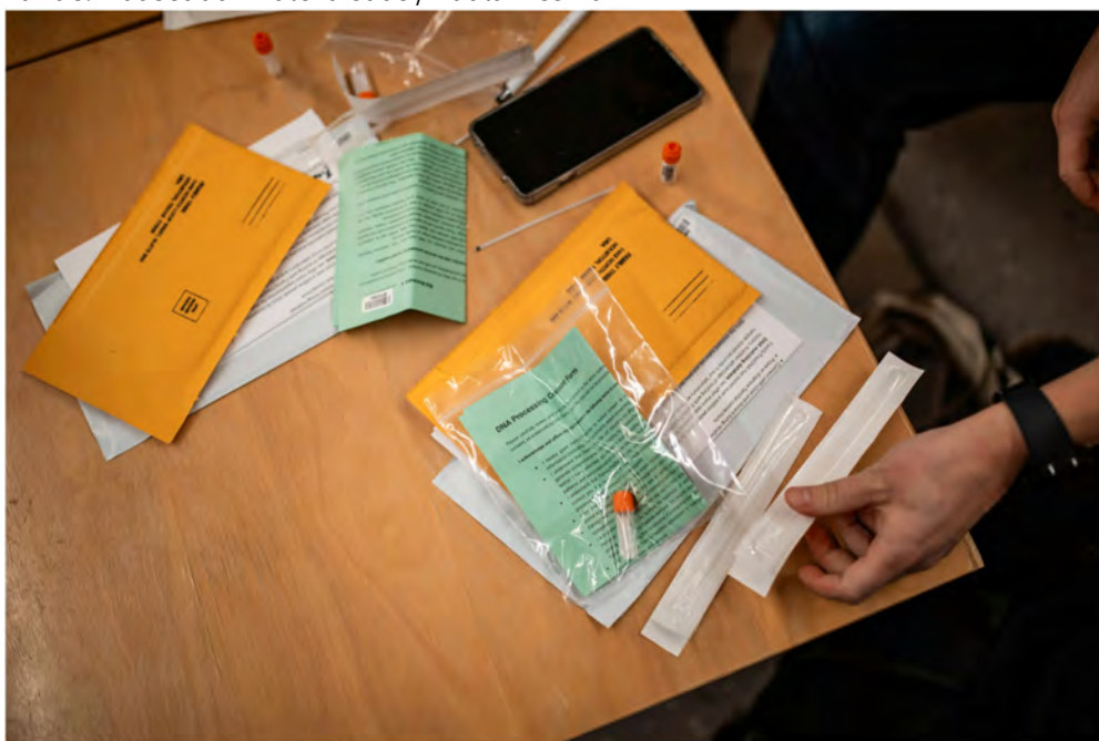
Kolehmaisien tutkimuksessa käytössä ovat Family Tree DNA:n isälinjaiset y-kromosomin testit.