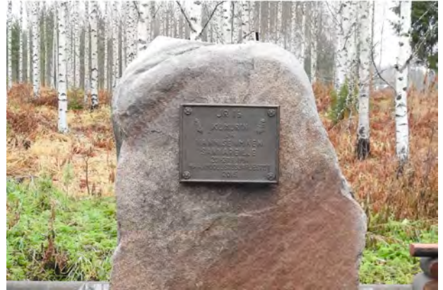
Vannisenmäen ja Kumurin taistelujen muistomerkki, Pahtaistentie, Valkeavaara, Kitee, Suomi. - Muistomerkki on vuodelta 2015.