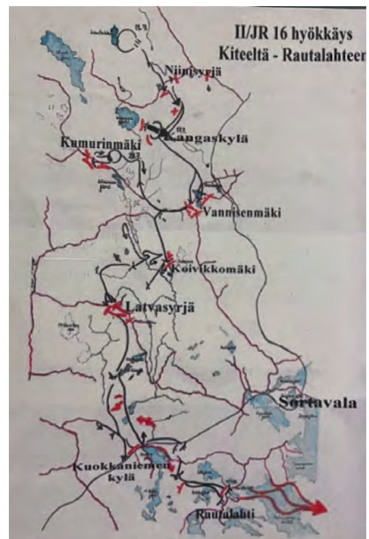
JR 16 ja 43. Rajakomppanian taistelupaikkoja

Kun jalkaväkirykmentti 16 oli saavuttanut Laatokan, koko rykmentistä oli haavoittunut 783 ja kaatunut 158 henkilöä. Toisesta pataljoonasta, johon Alavuden miehet kuuluivat oli haavoittunut 220 ja kaatunut 40 miestä.